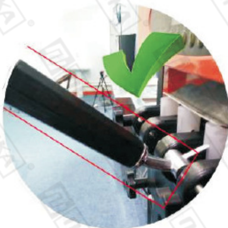
Правильное положение ручки