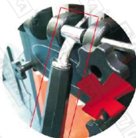
Неправильное положение ручки